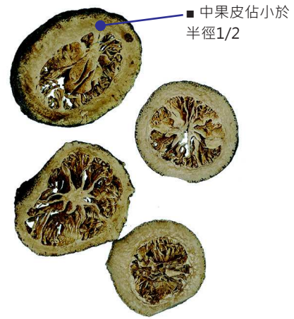
枳實 - 甜橙